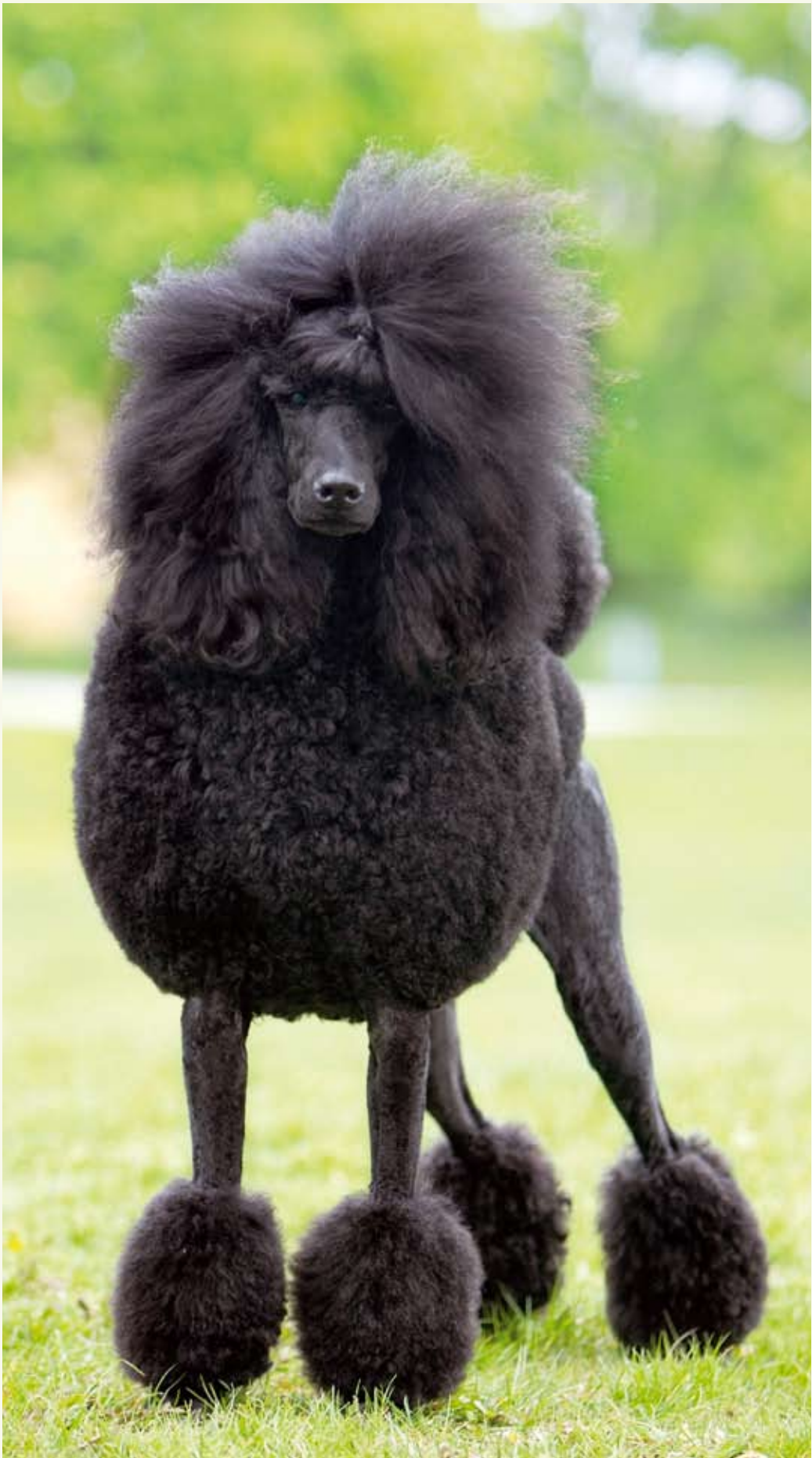
S t o r p u d e l