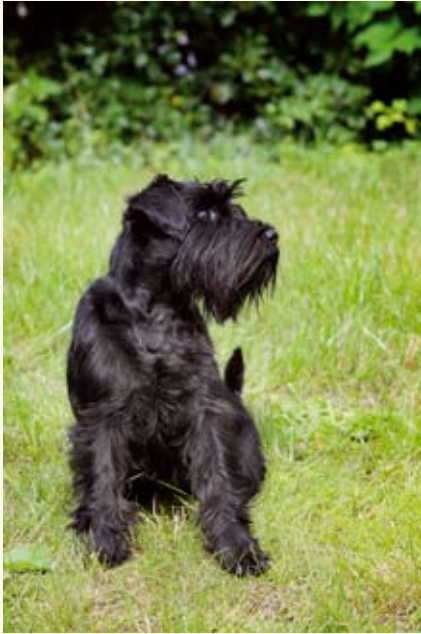
D v ä r g s c h n a u z e r