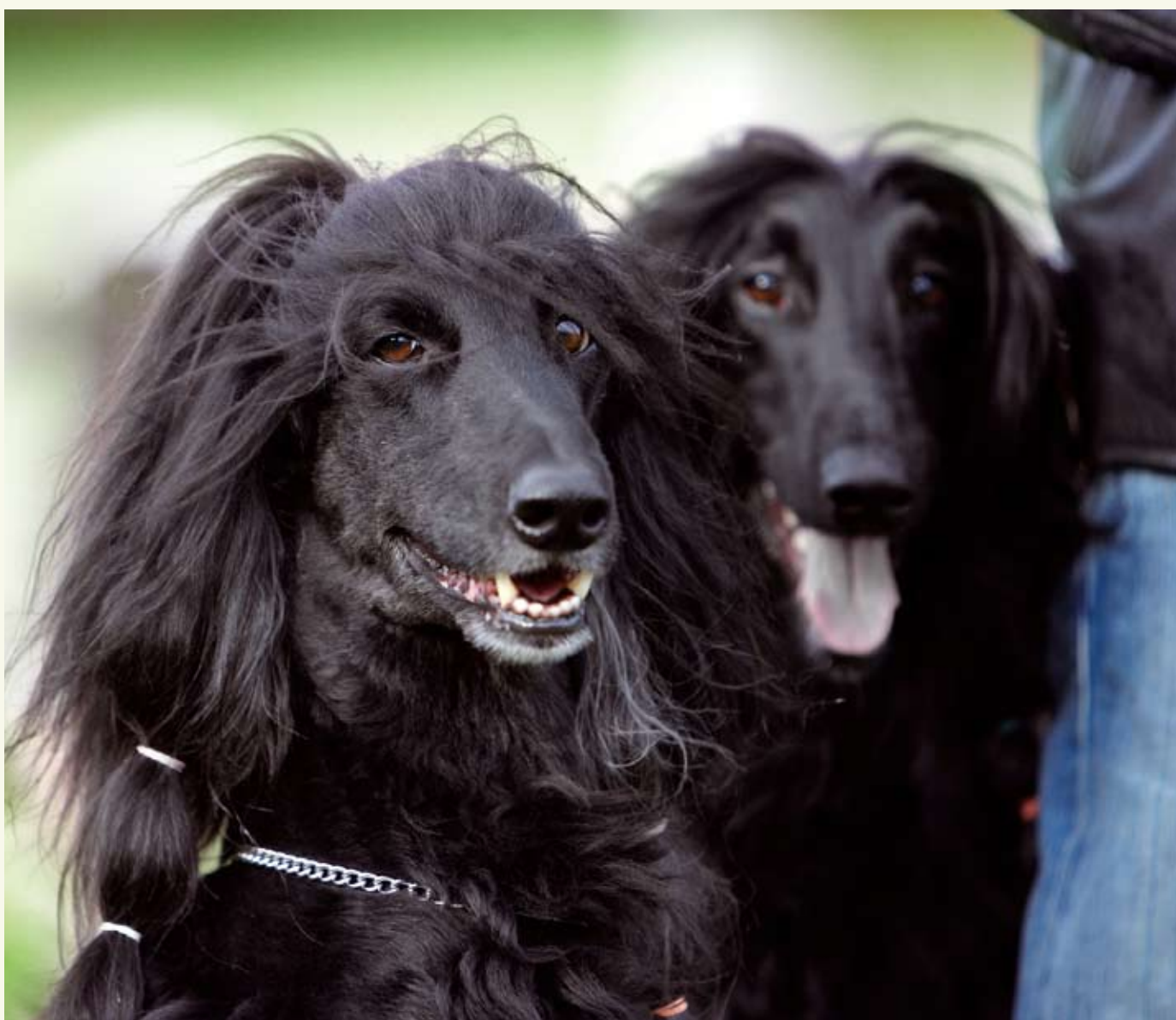
A f g h a n h u n d

Parningsavtalet finns att skriva ut från SKKs hemsida, www.skk.se . Du kan också beställa det från SKK. Avtalet finns även på engelska.