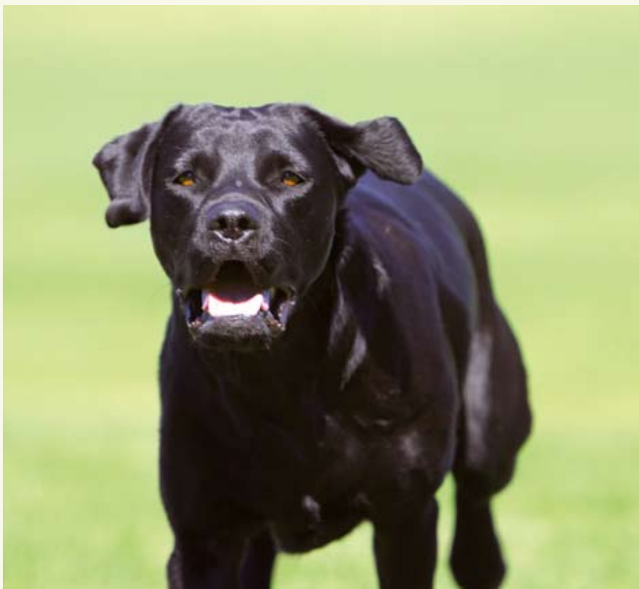
L a b r a d o r r e t r i e v e r

Mer information om kreditförsäljning kan du hitta på Konsumentverkets hemsida www.konsumentverket.se .